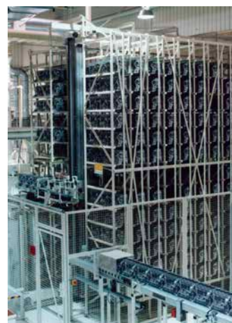
Retrofit für Hochregallager für Motorenblöcke