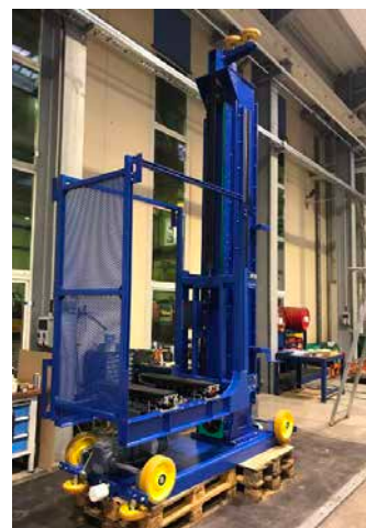
Verfahrwagen mit Hub